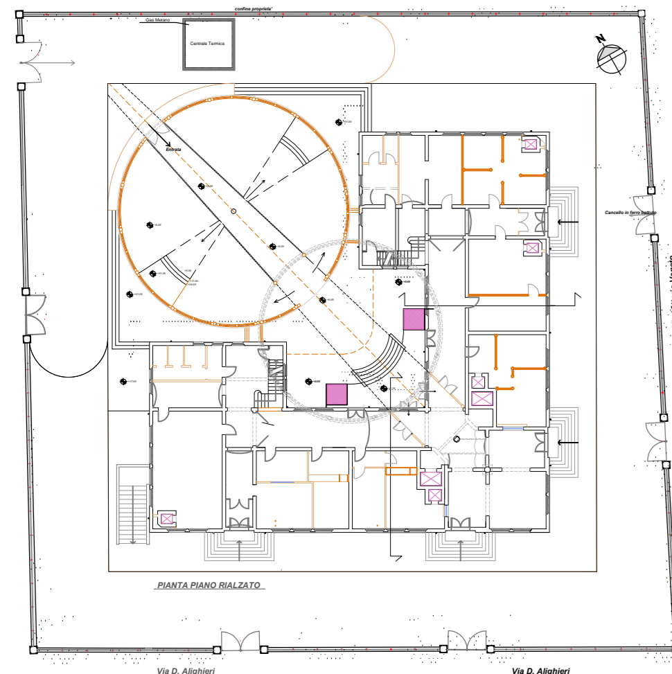
PIANTA PIANO RIALZATO QUOTA + 1,19